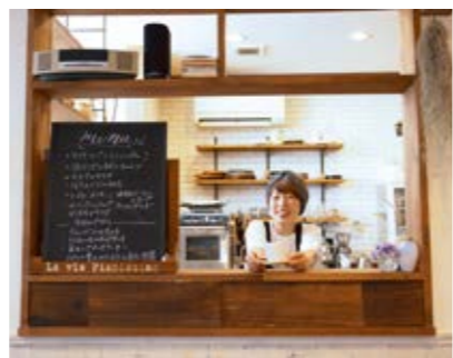
雑貨も購入いただけます

「Patrie (パトリ)という名前もフランス語「心のふるさと」という意味で、忙しく生きる皆さんが田舎に帰ってきたような感覚でお店を利用してもらえればと思います。」 「Patrie (パトリ)という名前もフランス語「心のふるさと」という意味で、忙しく生きる皆さんが田舎に帰ってきたような感覚でお店を利用してもらえればと思います。」 「Patrie (パトリ)という名前もフランス語「心のふるさと」という意味で、忙しく生きる皆さんが田舎に帰ってきたような感覚でお店を利用してもらえればと思います。」