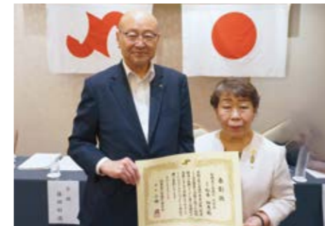
船橋商工会議所 女性会