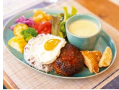
プレートランチ単品は1,200円、ドリンクとセット+200円、ドリンクとデザート+500円です。

可愛い雑貨や世界に一つだけのもの、おしゃれな雑貨、などが置いてある南フランスを手本に木のぬくもりを基調としています。