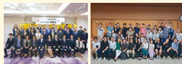
青年部では親睦を深める機会をご用意しています。

問合せ先 船橋商工会議所青年部事務局 長野 TEL 047-435-8211 (長野)