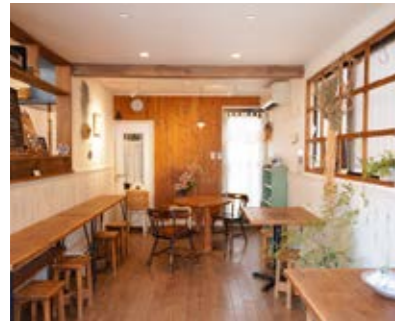
テーブルは3卓で6席、カウンター4席の計10席

「Patrie (パトリ)という名前もフランス語「心のふるさと」という意味で、忙しく生きる皆さんが田舎に帰ってきたような感覚でお店を利用してもらえればと思います。」 「Patrie (パトリ)という名前もフランス語「心のふるさと」という意味で、忙しく生きる皆さんが田舎に帰ってきたような感覚でお店を利用してもらえればと思います。」 「Patrie (パトリ)という名前もフランス語「心のふるさと」という意味で、忙しく生きる皆さんが田舎に帰ってきたような感覚でお店を利用してもらえればと思います。」