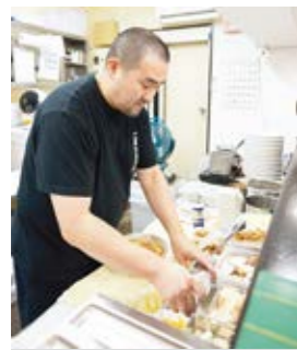
自家製トッピングもプラスして!

チャーシューは、脂身の少ない豚のもも肉を使用し、ジューシーで味がしみ込んでいます。お客様からは好評です。チャーシューと合わせて、店内で仕込みのメンマは、アルコールのつまみに注文される方が多いです。