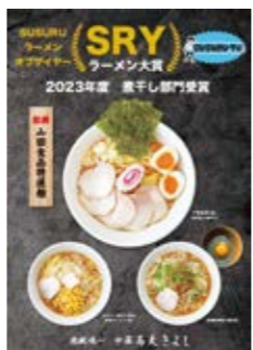
「SRY ラーメン大賞」を受賞

今日まで長らく船橋の地で地域住民に愛されてきました。今後は父が守り続けた味一の味を自分のお店とともに全国区へと広めていきたいと思っています。