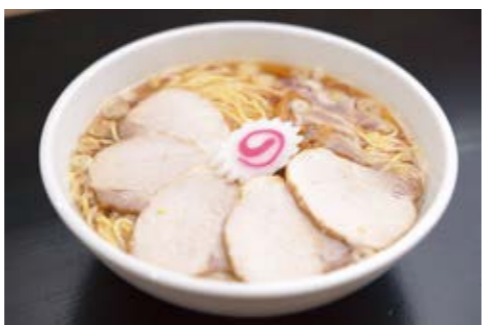
並盛 240g 800円(税込)

麺、まぜそばなどを提供している、ごはんや、ビール、レモンサワーなどのアルコールメニューも充実させています。夜はラーメンをつまみに飲む居酒屋に変わります。