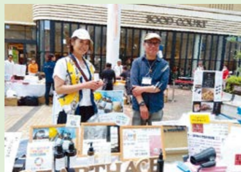
(株)ルノン化学研究所の出店の様子