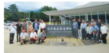
恐竜のロマンを感じて記念撮影バチリ!

スタートで「東尋坊」や「龍泉刃物ファクトリー」を視察。最後に「光る君へ 越前大河ドラマ館」を視察しました。出発直前まで台風10号に悩まされましたが皆様のご協力のもと開催することが出来ました。また台風により被害に遭われた方々に心よりお見舞い申しあげます。 (原)