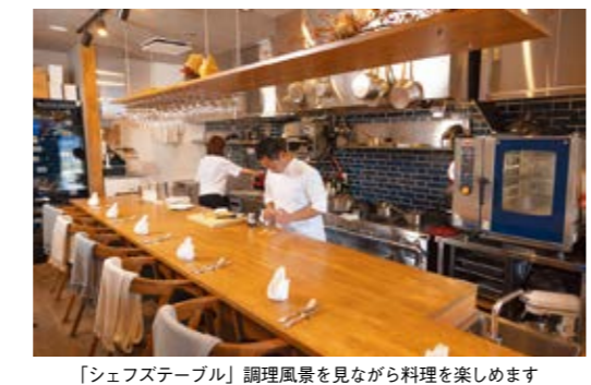
「シェフズテーブル」調理風景を見ながら料理を楽しめます

また、当店で提供するデザートは、アシエットデザート「その時その場所でしか食べられない五感で楽しむデザート」となります。普通のケーキでは味わえない、デザートによる演出、フランベ等による香り、温かいもの・冷たいものが同時提供できるので、ライブ感が味わえます。