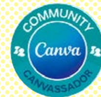
Canva コミュニティアンバサダー Canva 公式講師としてセミナーなどに登壇