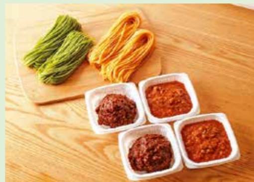
ふなばし野菜パスタ4食セット

TEL:047-411-8110 URL: https://www.fkbm.jp/