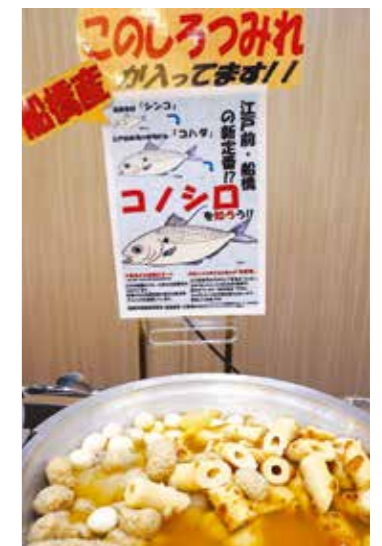
船橋市漁業協同組合より コノシロをご提供 いただきました