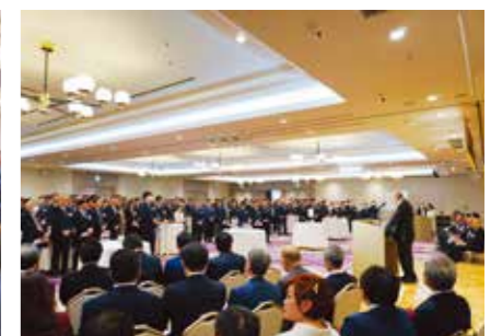
約250名の方々にご参加いただきました