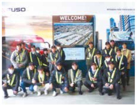
三菱ふそうトラック・バス現場での記念撮影の様子

国内及び輸出向けの小型・大型トラック等を製造しており、職員の方より会社の歴史や概要についてご説明頂きました。その後、工場内を見学し、エンジンやトランスミッション、エンジンの組み立て等のご案内を頂きました。川崎大師では、建設業部会の益々の発展を祈願し、お護摩祈禱に参加しました。仲見世商店街の散策やお土産の購入、食べ歩き等を楽しみ