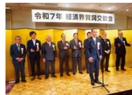
11 主催団体の皆さま