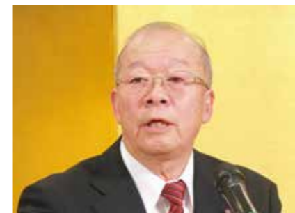
渡辺賢次市議会議長のご祝辞