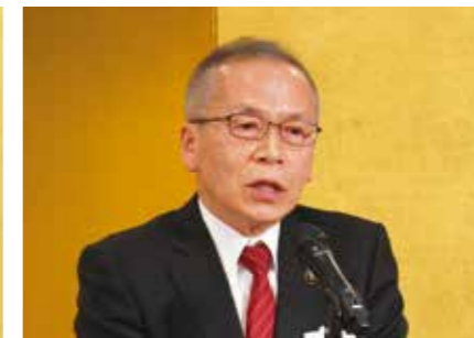
松戸徹船橋市長のご挨拶