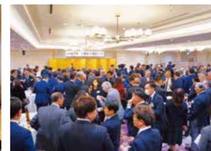
時間の許す限り交流を深めました