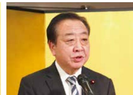
立憲民主党 野田佳彦代表のご祝辞